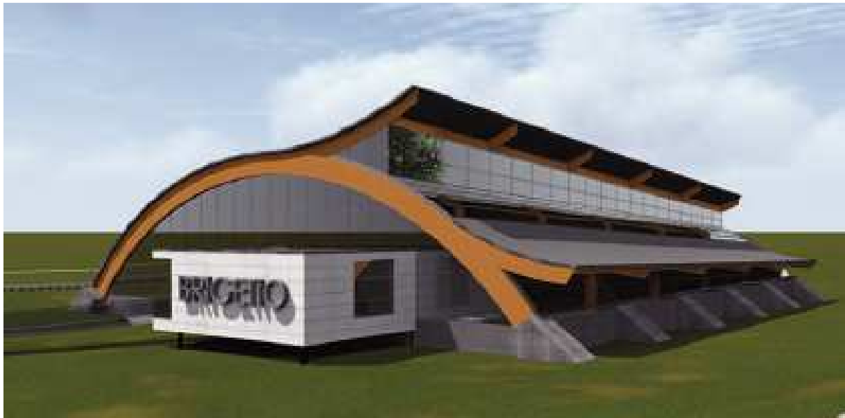
2. ábra: A tervezett látogatóközpont látványterve. (Építészek: Siklósi József és Hartmann Tihamér)

A már engedélyezési terv szintű épületterv szerint a látogatóközpont beépített területe 1657,91 m 2 lesz. Ez a nagyméretű vasúti telken a hatályos szabályok szerint is elhelyezhető, mégis a terület világörökség várományos státuszához méltóbb és a hosszútávú használatnak jobban megfelel, ha a területet átsoroljuk a KÉSZ szerinti különleges területek közé, az erődök után újabb örökségvédelmi prioritású területfelhasználási egységet létrehozva.