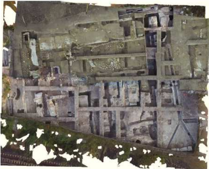
1. ábra: A régészeti feltárás ortofotója

Az új komáromi árvízvédelmi töltés építése során végzett régészeti feltárás hozta felszínre a katonavárosi fürdő romjait.