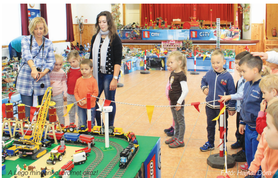
A Lego mindenhol örömet okoz!