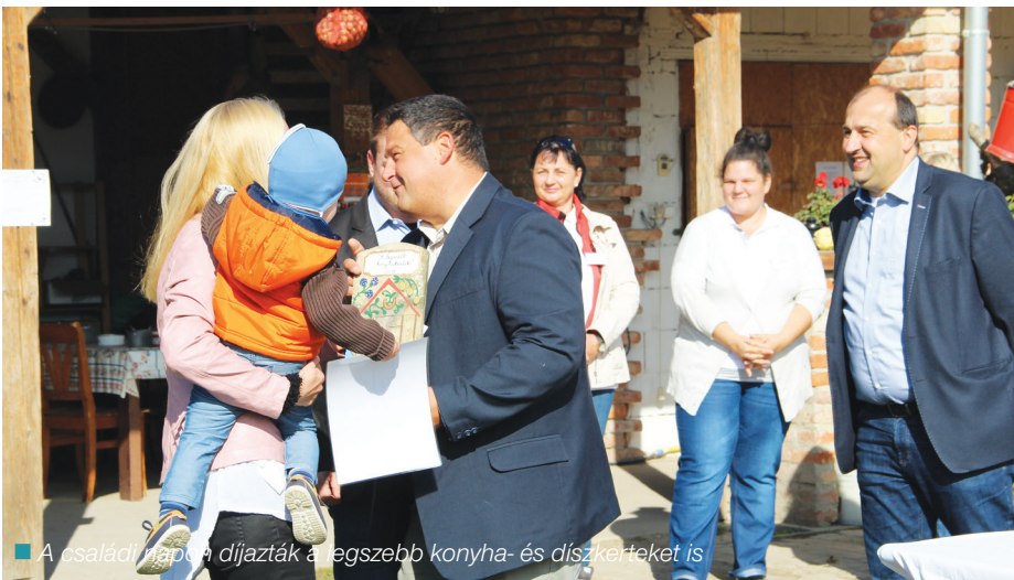
A családnapot a díjazták a legszebb konyha- és díszkerteket is

KITÁRTA KAPUIT AZ ÉRDEKLŐDŐK ELŐTT A SZŐNYI LOVAS EGYESÜLET ÉS A KEMENCE EGYESÜLET. NEMRÉG CSALÁDI NAPOT TARTOTTAK A NŐK A KÖZPONTBAN ELNEVEZÉSŰ EURÓPAI UNIÓS PROJEKT RÉSZÉKÉNT. A PROGRAM A KORMÁNY ÁLTAL KEZDEMÉNYEZETT CSALÁDOK ÉVÉHEZ KAPCSOLÓDOTT.