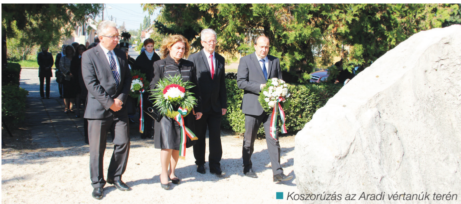
■ Koszorúzás az Aradi vértanúk terén

A NEMZETI SZÍNŰ LOBOGÓ ÁRNYÉKÁBAN GYÜLEKEZTEK AZ ARADI VÉRTANÚKRA EMLÉKEZŐK OKTÓBER 6-ÁN. EZÚTTAL A PETŐFI ADOTT MŰSORT.