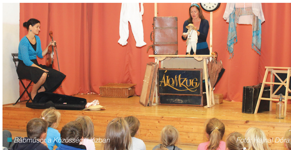
Bábmozdulat a Közösségi Házban