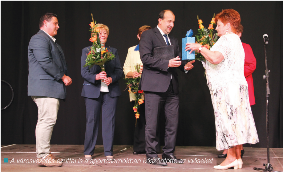
A városvezetés ezúttal is a sportcsarnokban köszöntötte az időseket

VÁROSRESZ NYUGDÍJAS KLUBJAINAK TAGSÁGA VETT RÉSZT.