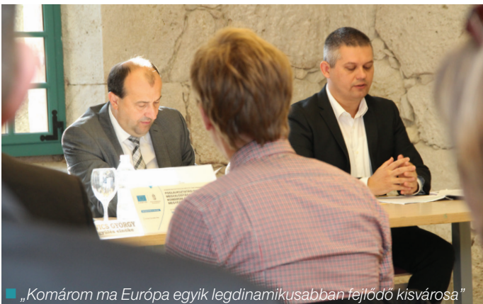
„Komárom ma Európa egyik legdinamikusabban fejlődő kisvárosa”

344 MILLIÓS UNIÓS TÁMOGATÁS SEGÍTÉSÉVEL ZÁRULT A MEGYEI ÖNKORMÁNYZAT ÉS PARTNEREI, A MEGYEI KORMÁNYHIVATAL ÉS A TERÜLETFEJLESZTÉSI KFT. ÁLTAL MEGVALÓSÍTOTT FOGLALKOZTATÁSI PROJEKTJE. A ZÁRÓESMÉNYPONTOKTÓL OKTÓBER KÖZEPÉN KERÜLT SOR A MONOSTORI ERŐDBEN.