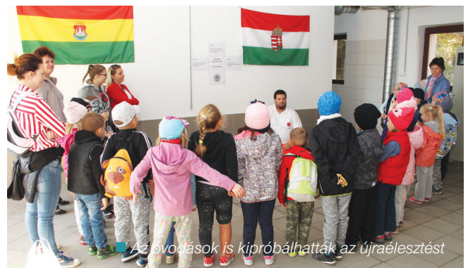
Az óvodások is kipróbálhatták az újraélesztést