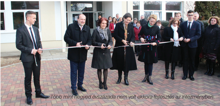
Több mint negyed évszázada nem volt ekkora fejlesztés az intézményben

FEBRUÁR 12-ÉN HIVATALOSAN IS MEGTÖRTÉNT A KULTSÁR SZAKKÖZÉP-ISKOLA 120 MILLIÓ FORINTBÓL FELÚJÍTOTT ÉPÜLETÉNEK ÁTADÁSA.