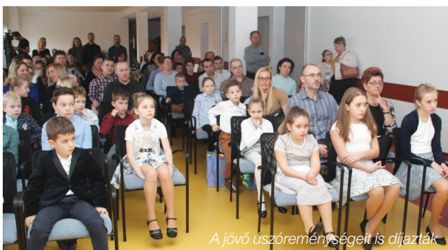
A jövő úszóreményeseit is díjazták