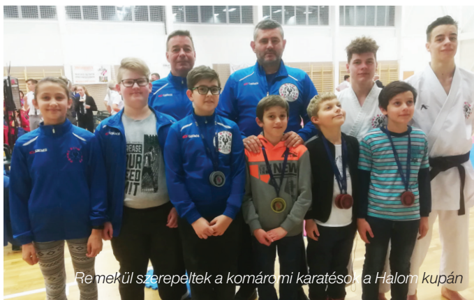
Re mekül szerepéltek a komáromi karatésok a Halom kupán