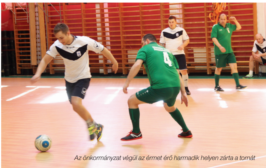
Az önkormányzat végül az érmet érő harmadik helyen zárta a tornát

24 ÓRA MEGYEI NAPILAP CSAPATA MÉRTE ÖSSZE EREJÉT ÉS ÜGYESSÉGÉT.