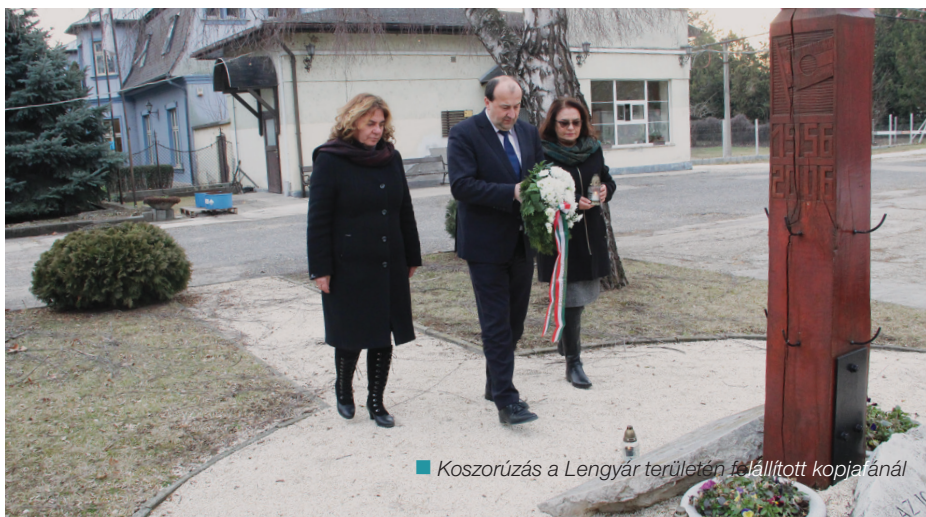
■ Koszorúzás a Lengyár területén felállított kopjafánál

MÁR 2000. JÚNIUS 13-A ÓTA, A MAGYAR ORSZÁGGYŰLÉS DÖNTÉSE ALAPJÁN.