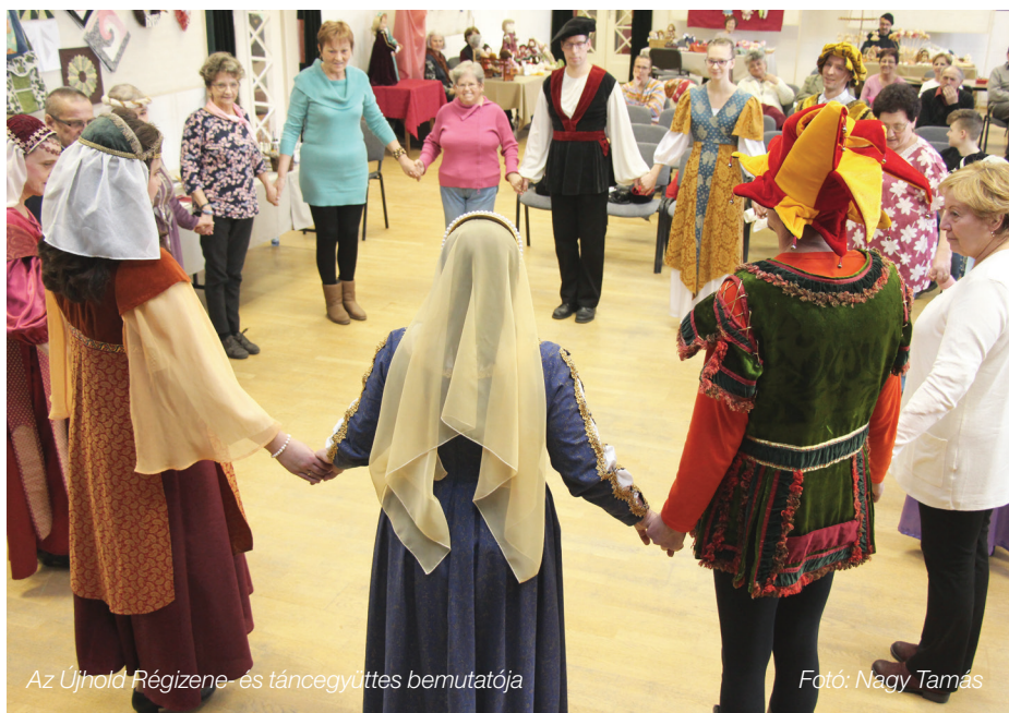
Az Újhold Régizene- és táncgyűttes bemutatója

Az első festményét már férje bátorítására készítette el. Az első téli táj otthonát díszíti. 2012-től tagja lett egy budapesti műteremnek, ahol festőtársaitól is sokat tanult, velük közös kiállításokon mutathatta be a természetben festett alkotásait. Az ihletet kirándulások alkalmával és jól sikerült fotókból meríti. A tájképfestészet mellett különösen kedveli a csendéleteket, és időnként állatokról is fest.