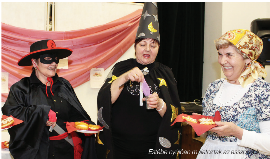
Estébe nyúlóan mulatoztak az asszonyok

Az asszonyfarsangról a 15. századtól kezdve vannak írásos feljegyzések. Főleg a Dunántúlon tartották ezeket a mulatságokat, a szlovák és a német nemzeti kisebbségek éltették a hagyományt. Az asszonyoknak régen nem volt szabadidejük, évente egyszer kaptak kimenőt. Ilyenkor vagy valamilyükknél, a kocsmában vagy a fonóban szervezték meg az asszonyfarsangot.