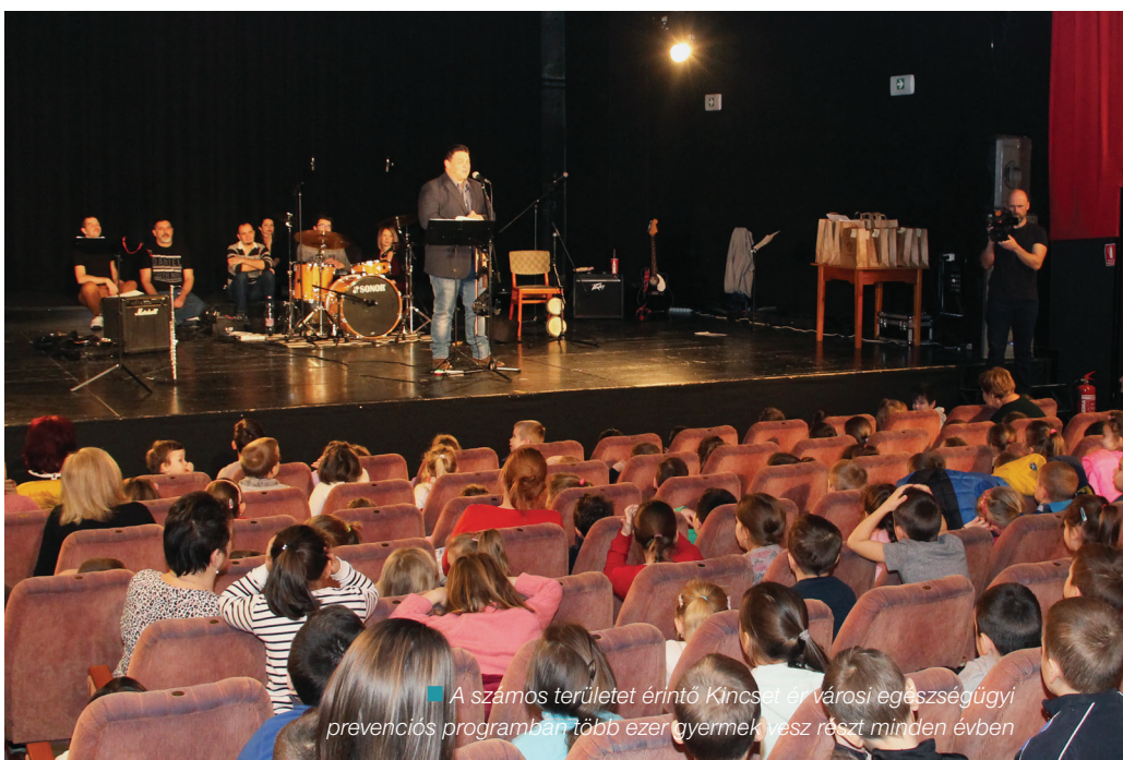
A számos területet érintő Kincset ér! városi egészségügyi prevenciós programban több ezer gyermek vesz részt minden évben

A MOZI ELŐTERÉBEN TEKINTHETTÉK MÉG AZ ODALÁTOGATÓ ÉRDEKLŐDŐK.