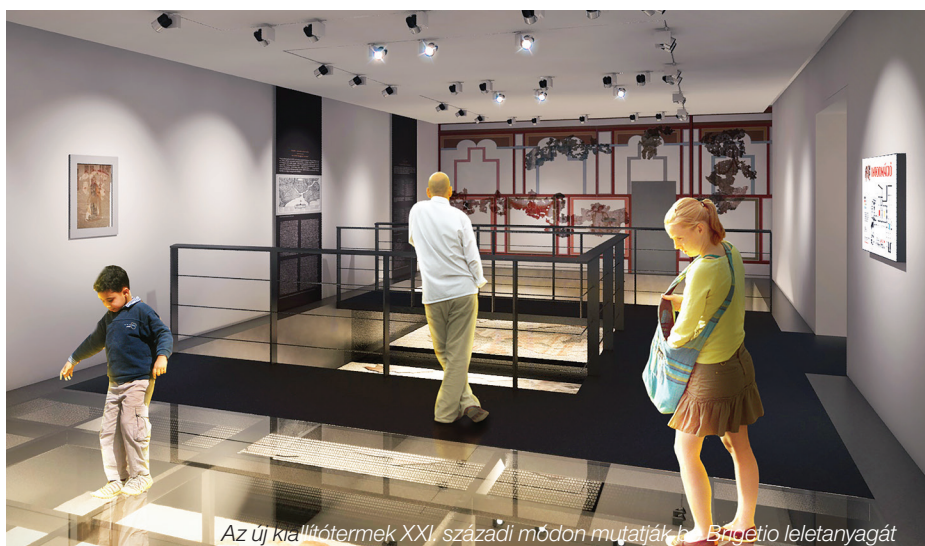
Az új kiállítótermek XXI. századi módon mutatják be Brigetio leletanyagát

KOMOLY VÁLTOZÁST HOZ A MÚZEUM ÉS VÁROSUNK ÉLETÉBE IS KÉT ELŐRE- MOZDÍTÓ ÉPÍTKEZÉS. KEZDŐDIK A VOLT MEZŐGAZDASÁGI KOMBINÁT ÁTÉPÍ- TÉSE, AHOVÁ A MÚZEUM FŐÉPÜLETE KÖLTÖZIK, VALAMINT SZINTÉN HAMA- ROSAN INDUL A BRIGETIO LÁTOGATÓKÖZPONT-BERUHÁZÁS IS.