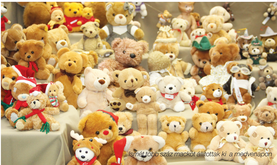
Ismét több száz mackót állítottak ki a medvenapon

MEDVENAP, RENESZÁNSZ NAP, KIÁLLÍTÁS ÉS ASSZONYFARSANG. A MÚLT HÓNAPBAN NEM VOLT OLYAN HÉT, HOGY NE LETT VOLNA VALAMI PROGRAM A PETŐFI MŰVELŐDÉSI HÁZBAN.