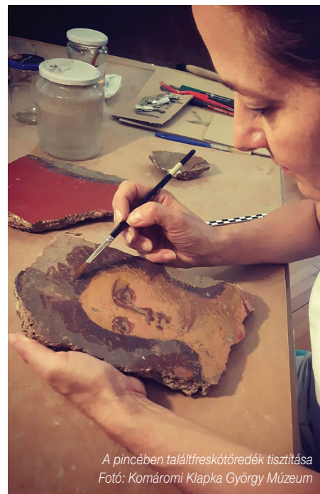
A pincében talált freskótöredék tisztítása

Számadó Emese és Bartus Dávid hangsúlyozták, bíznak abban, hogy a terület a Világörökség része lesz, és akkor lehetőség nyílik a helyszíni bemutatásra is. Addig is a várhatóan jövő nyáron megnyíló új Klapka György Múzeumban virtuálisan bemutatható lesz a leletanyag. (ta)