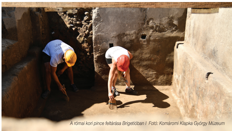
A római kori pince feltárása Brigetióban | Fotó: Komáromi Klapka György Múzeum

Kiváló állapotban megmaradt ókori pincét tártak fel a régészek az egykori katonaváros, Brigetio területén. A föld alatti építmény csatornázási munka során bukkant elő.