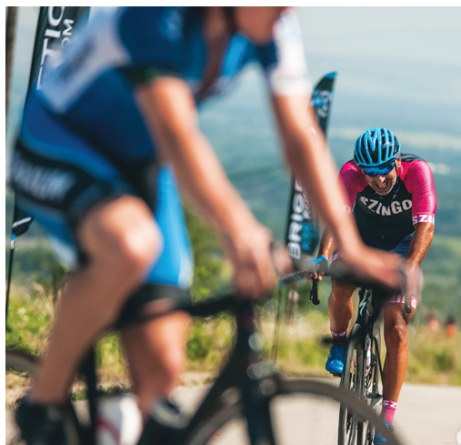
A VI. Brigetio Országúti Mezőnyverseny ezúttal Dunaalmásról indult