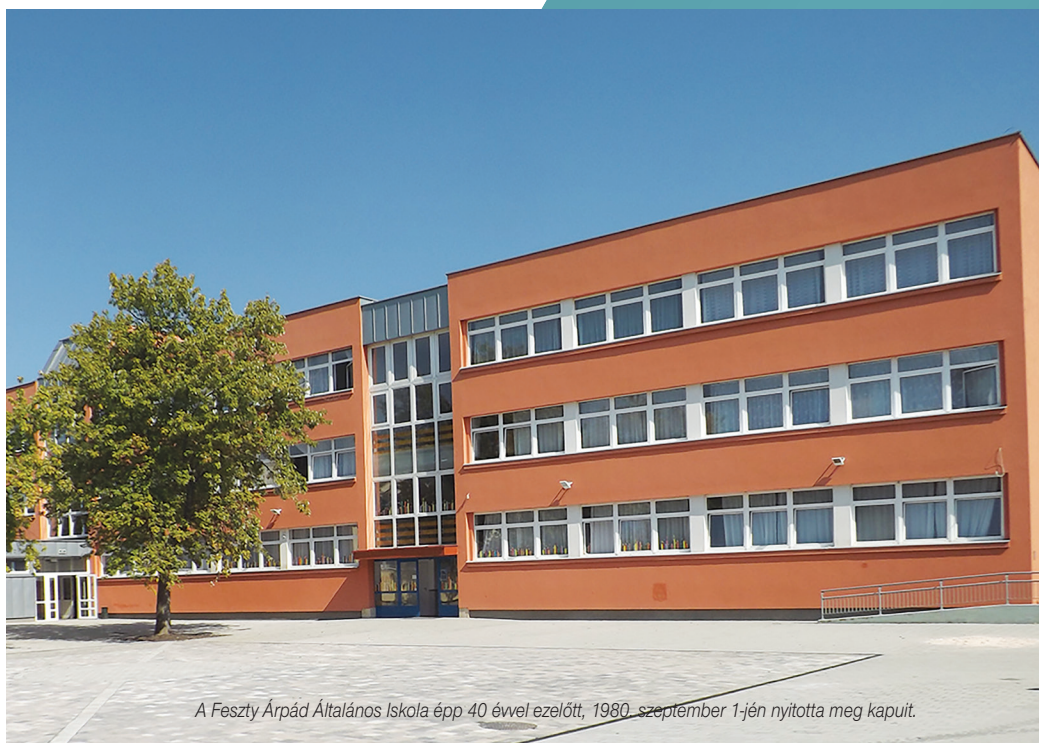
A Feszty Árpád Általános Iskola épp 40 évvel ezelőtt, 1980. szeptember 1-jén nyitotta meg kapuit.

Az utóbbi években az iskola teljes energetikai korszerűsítésen és udvarfelújításon esett át. (gl)