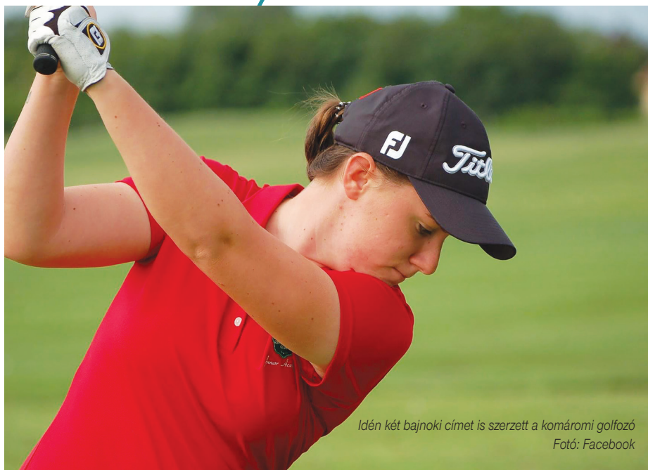
Idén két bajnoki címet is szerzett a komáromi golfozó