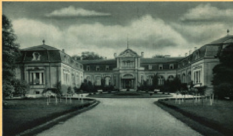
Szalay György Győrky-kastély.