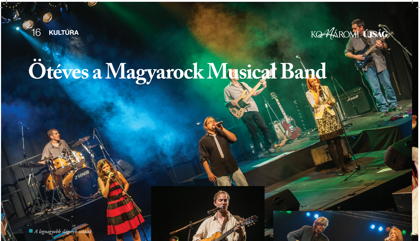
■ A legnagyobb slágerek szóltak

A jubileumot november 29-én a sportcsarnokban nagyszabású koncerttel ünnepelték, ahol csak a legnagyobb slágerek szóltak.