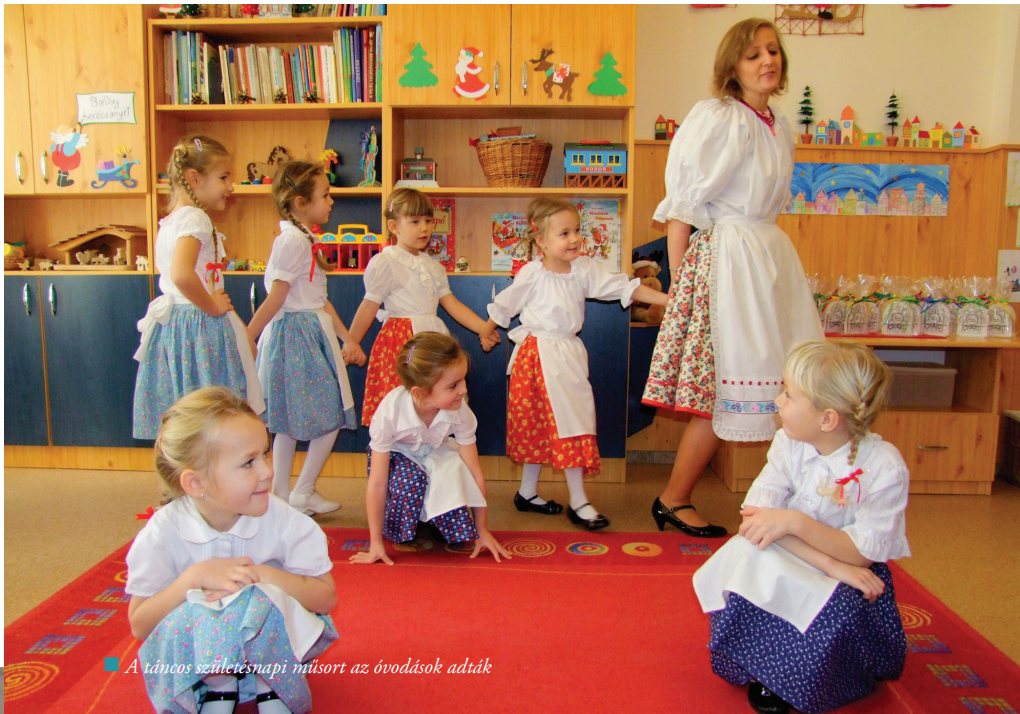
■ A táncos születésnapi műsort az óvodások adták

Az intézmény 1973. december 1-jén nyitotta meg kapuit V. számú Napköziotthonos Óvoda néven a Petőfi Sándor Általános Iskola falain belül. Csak egy évvel később kerültek át abba a kétszintes épületbe, ami a mai napig helyet ad az intézménynek.