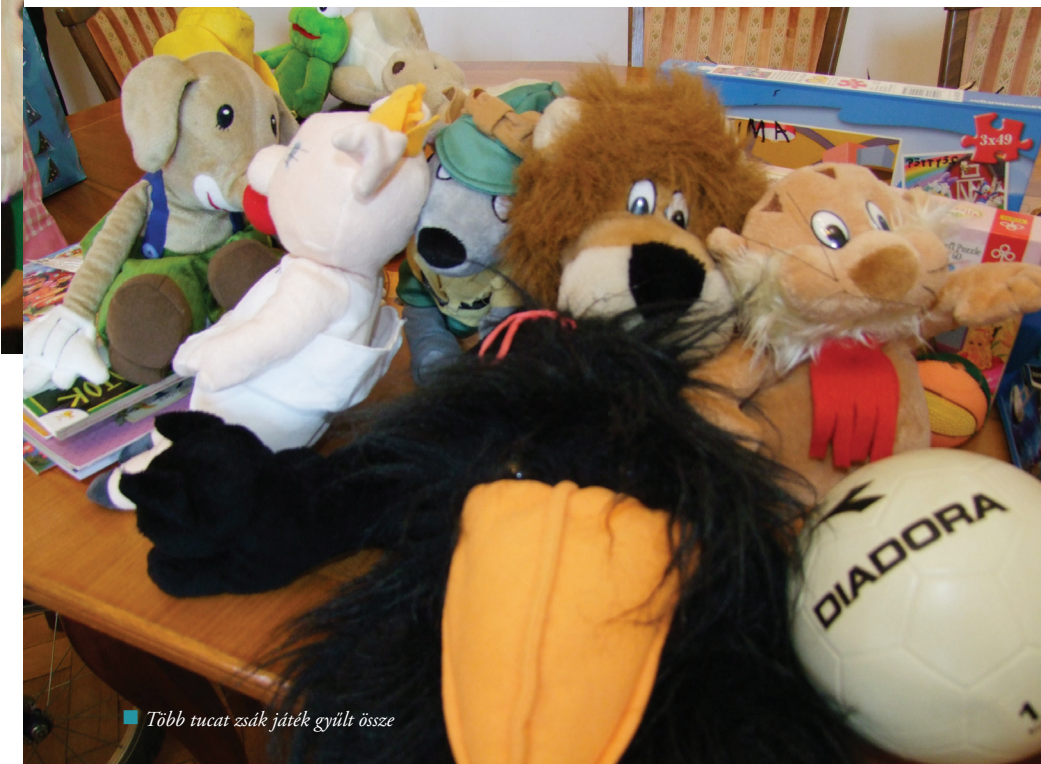
■ Több tucat zsák játék gyűlt össze

A polgármesteri hivatal dolgozói is bekapcsolódtak a helyi Családsegítő és Gyermekjóléti Szolgálat játékgyűjtési akciójába. A program célja, hogy lehetőség szerint minden helyi kisgyermek találjon valamilyen ajándékot a fa alatt. A felajánlások átadására december 6-án került sor.