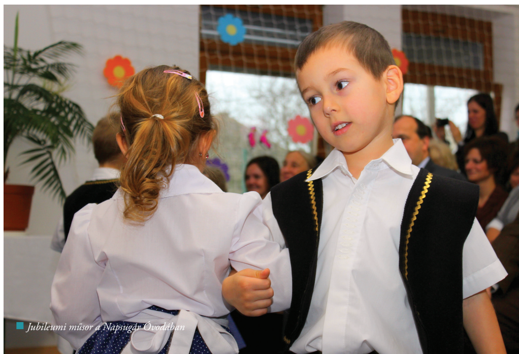
Jubileumi műsor a Napsugár Óvodában