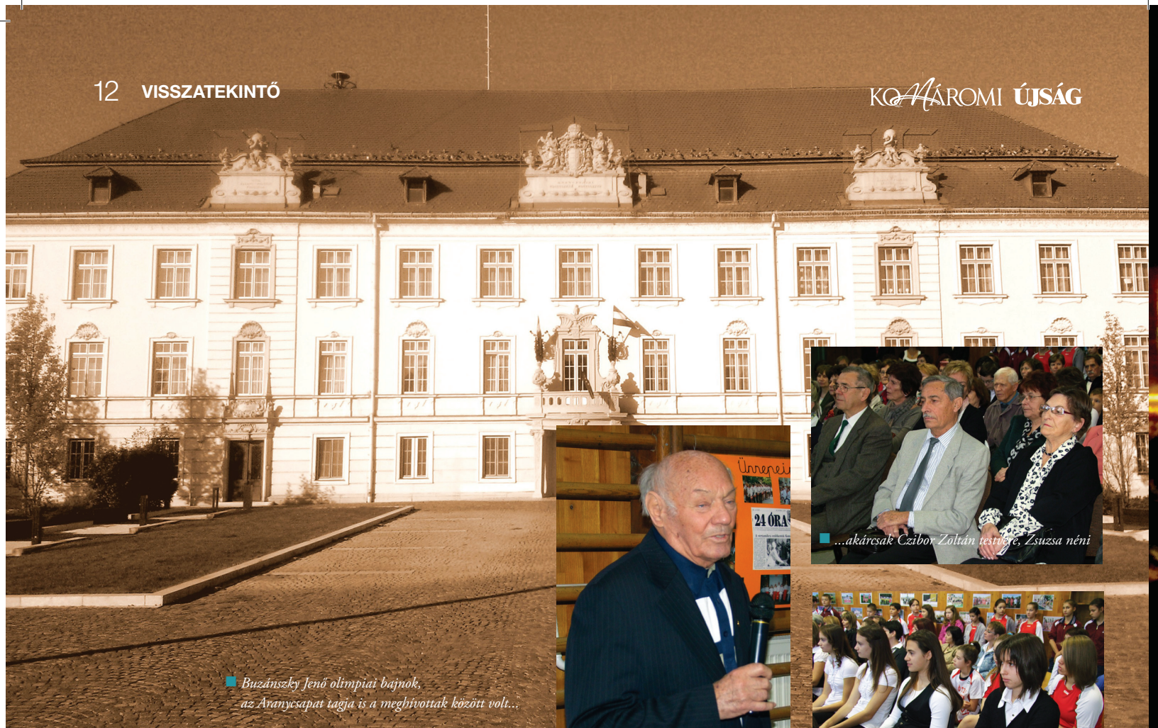
Buzánszky Jenő olimpiai bajnok, az Aranycsapat tagja is a meghívottak között volt...